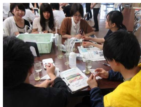
令和元年度（2019年度）田崎市場体験