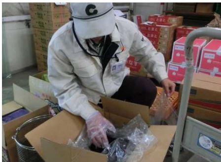
（野菜の残留農薬検査のための収去）