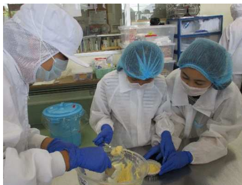
令和元年度（2019年度）パティシエ気分学ぶ食品衛生教室 （マドレーヌ作りを通して食品衛生について学びました）