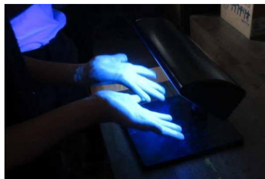
令和元年度（2019年度）手洗い教室