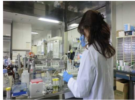
（食品の理化学検査）