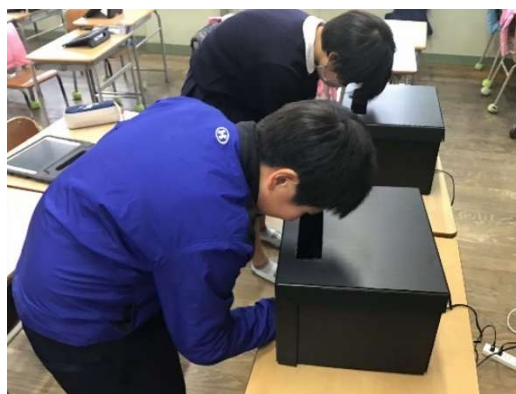
▲手洗いチェッカー貸出事業