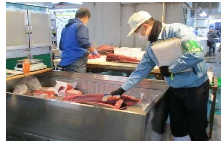
▲食品の温度管理の確認