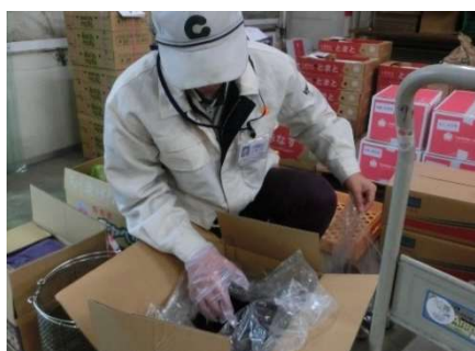
▲野菜の残留農薬検査のための収去