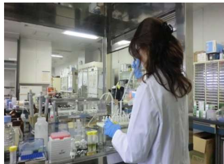
▲食品の理化学検査